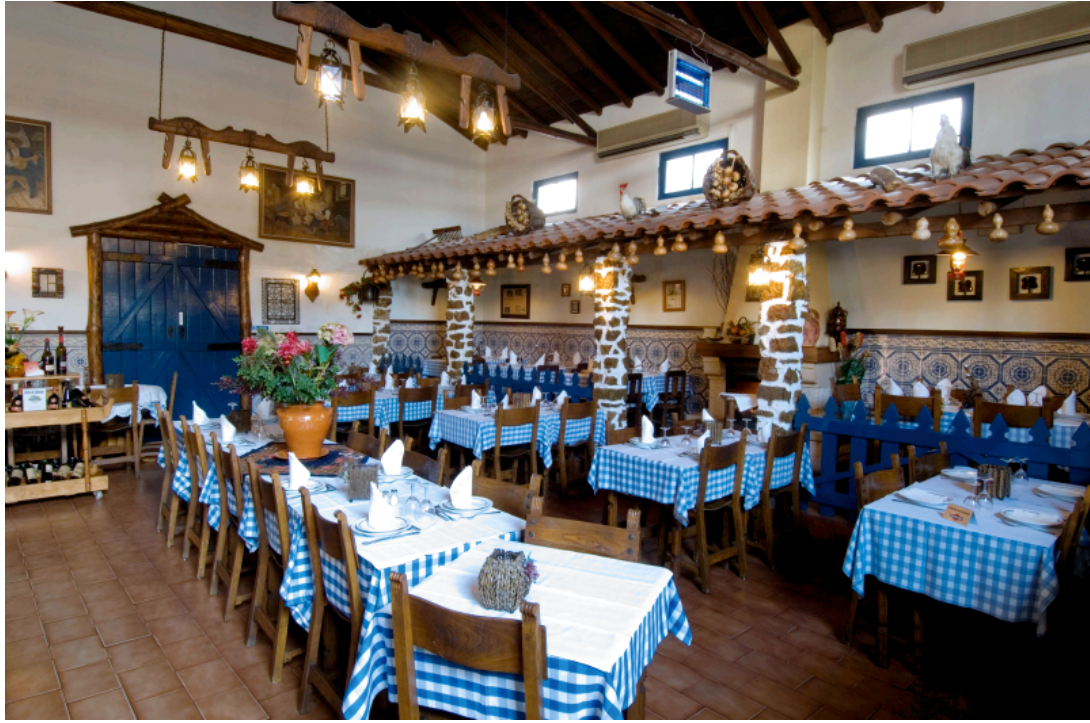
restaurante Barrete Saloio